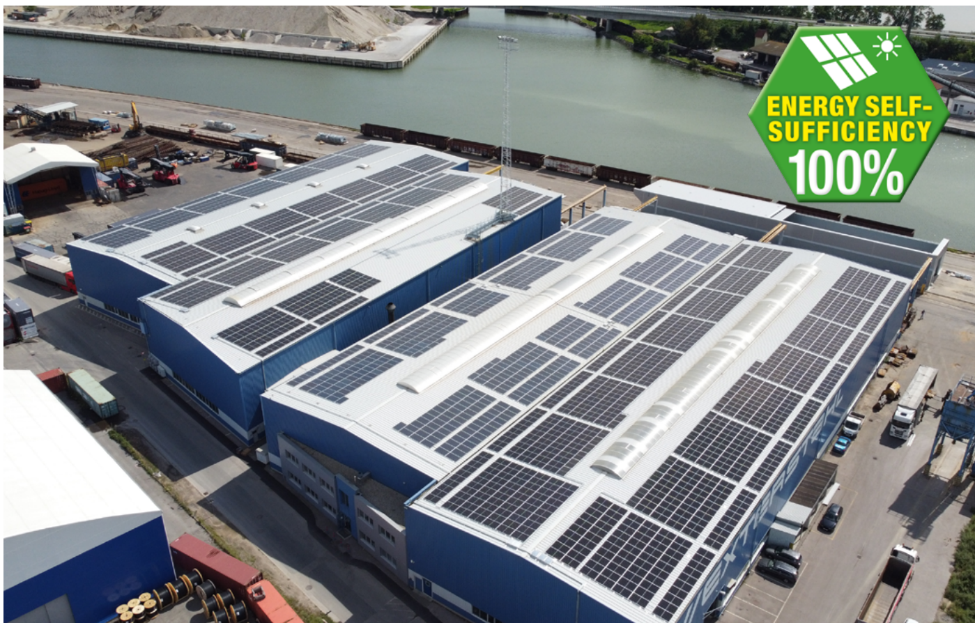
Unsere PV Anlage in Krems